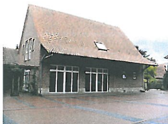
.....in der Evers'schen Mühle in Schale