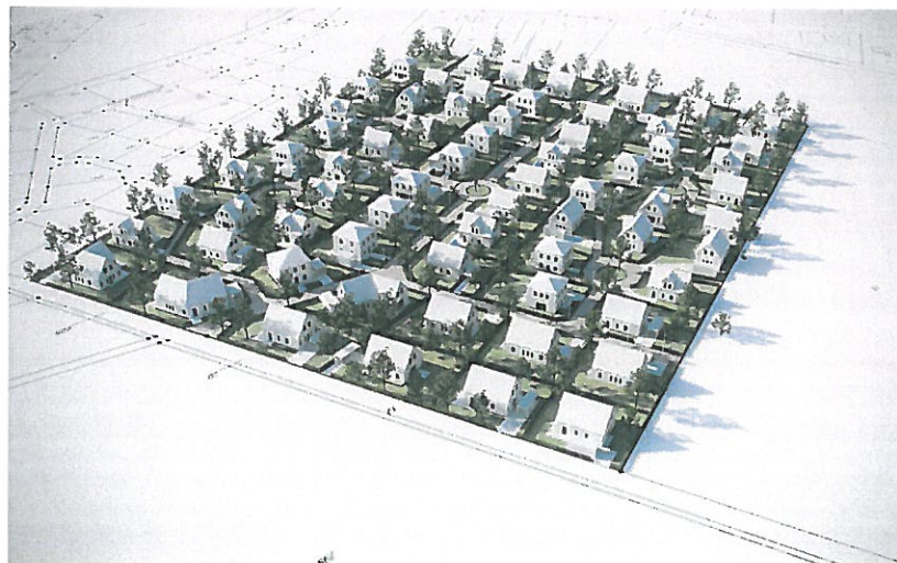
Baugebiet „Kreimers Kamp“, III. Bauabschnitt