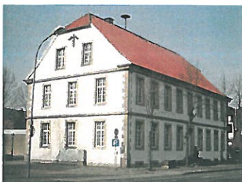
... im BürgerHaus Veerkamp in Hopsten