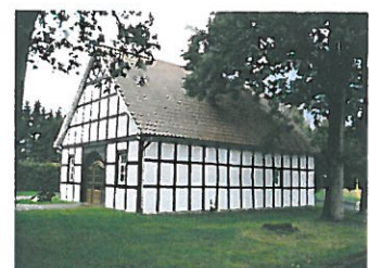
... im Heimathaus in Halverde