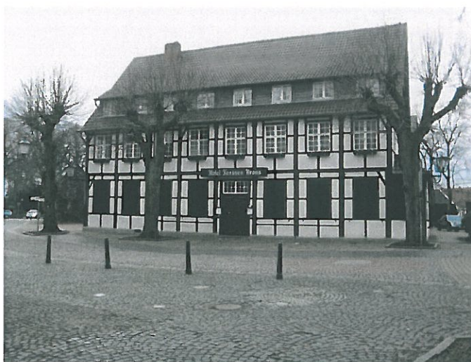
Denkmal Hotel Kerssen-Brons, Hopsten