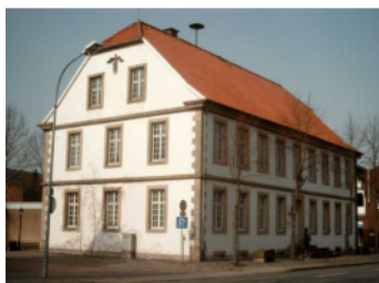
... im BürgerHaus Veerkamp in Hopsten