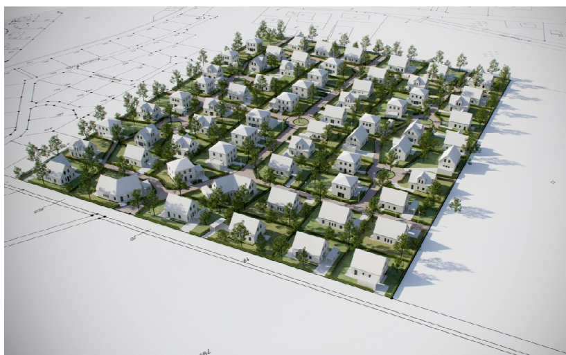
Baugebiet „Kreimers Kamp“, III. Bauabschnitt