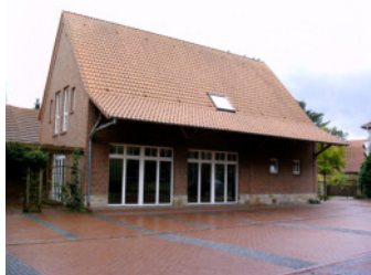
....in der Evers'schen Mühle in Schale