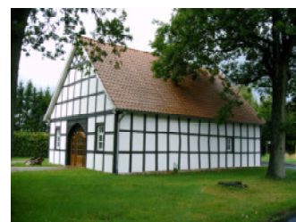
... im Heimathaus in Halverde