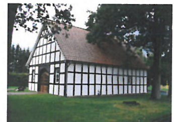
... im Heimathaus in Halverde