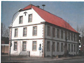
... im BürgerHaus Veerkamp in Hopsten