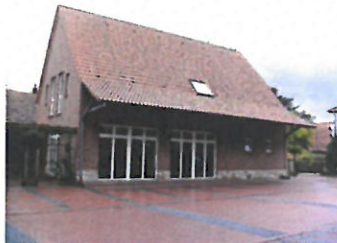
.....in der Evers'schen Mühle in Schale